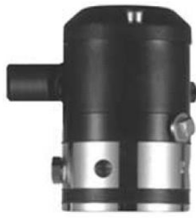
αναλογικός ρυθμιστής θέσης 8047