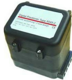
ψηφιακός ρυθμιστής θέσης 8049